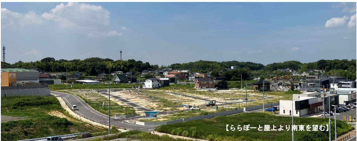
【ららぽーと屋上より南東を望む】