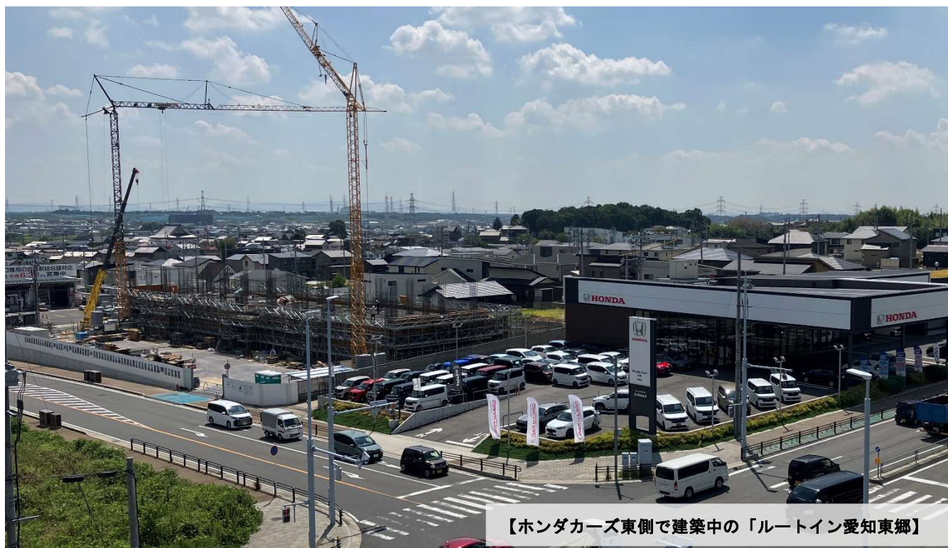
【ホンダカーズ東側で建築中の「ルートイン愛知東郷」】