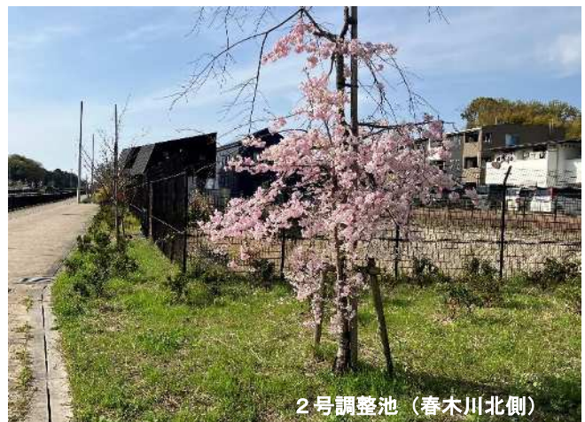
2号調整池（春木川北側）