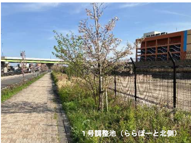
1号調整池（ららぽーと北側）