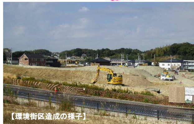
【環境街区造成の様子】