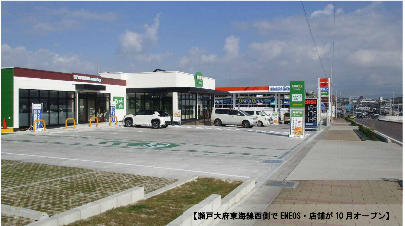
【瀬戸大府東海線西側で ENEOS・店舗が 10 月オープン】