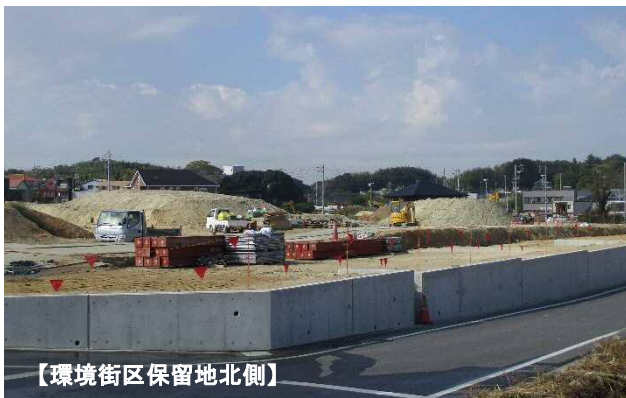
【環境街区保留地北側】