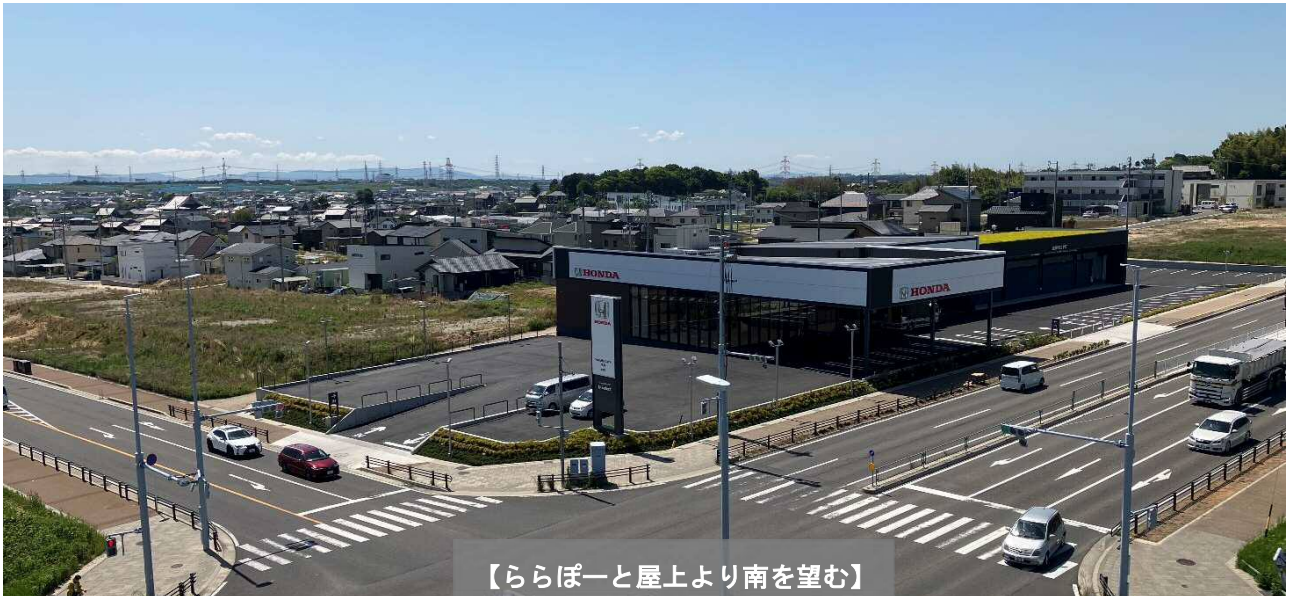
【ららぽーと屋上より南を望む】