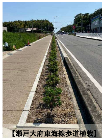
【瀬戸大府東海線歩道植栽】

令和5年6月に発注した造成等工事（25街区整地工、和合春木線修繕工、公園・ラウンドアバウト植栽工等）は、瀬戸大府東海線歩道の植栽工を施工中です。この植栽工が終わると当該工事は完成となりますが、施設管理引継ぎのための修繕工や緊急時の工事対応に備え、鹿島道路(株)と協議のうえ契約工期を令和6年8月末まで延期しました。